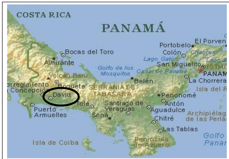
Figura1. Ubicación Geográfica de la comunidad