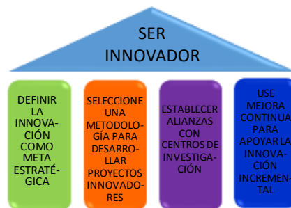
Figura 1 Modelo de la Gestión de Innovación