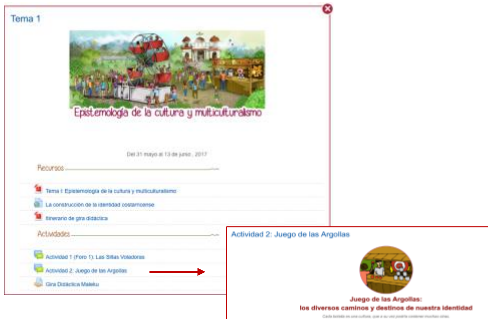
Figura 5. Ejemplificación del uso de la metáfora en todos los elementos que conforman el entorno de la asignatura Multiculturalidad y Ética del Turismo, desarrollado durante el I Cuatrimestre 2016. Elaboración propia.