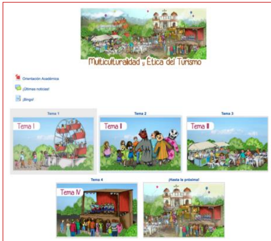
Figura 4. Visualización del entorno gráfico y organizativo de la asignatura Multiculturalidad y Ética del Turismo en la Plataforma Moodle, desarrollado durante el I Cuatrimestre 2016. Elaboración propia.