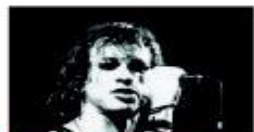
Laura Jane Grace

CONOCIDO por ser uno de los directores de la saga Matrix . Lawrence Larry Wachowski habló abiertamente sobre su transición a mujer hace tres años.