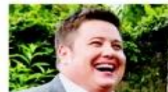
Chaz Salvatore Bono

BRUCE Jenner debutó como mujer hace exactamente una semana. "Call me Caitlyn", dijo el exatleta olímpico, de 65 años, a Vanity Fair , revista en la que posó.