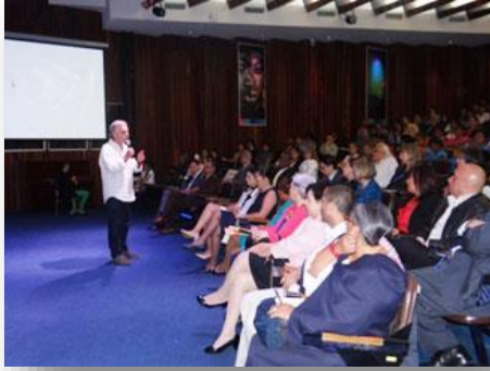
Imagen del Congreso “ Inclusividad, No Discriminación y Acceso a la Justicia ”, enviado por el Departamento de Prensa y Comunicación Organizacional del Poder Judicial